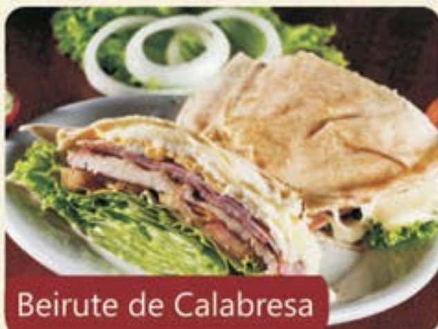
Beirute de Calabresa