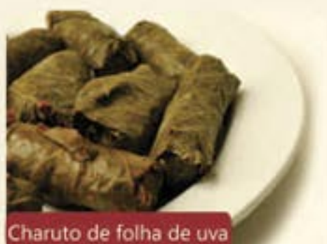
Charuto de folha de uva