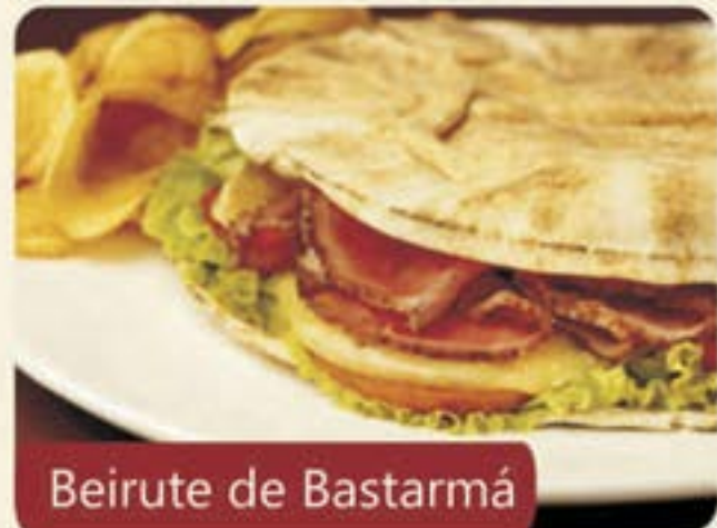
Beirute de Bastarmá