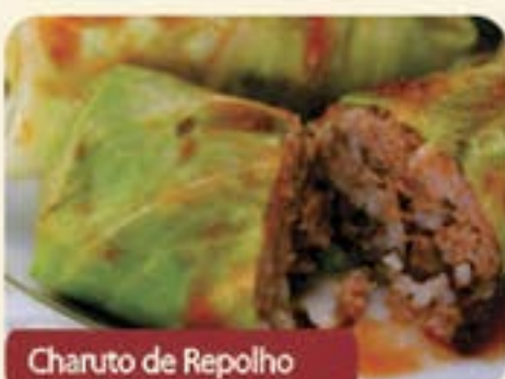
Charuto de Repolho