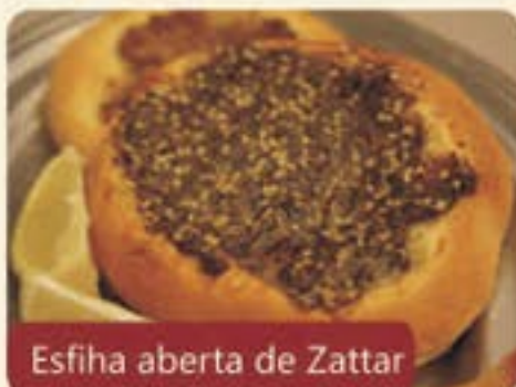
Esfiha aberta de Zattar