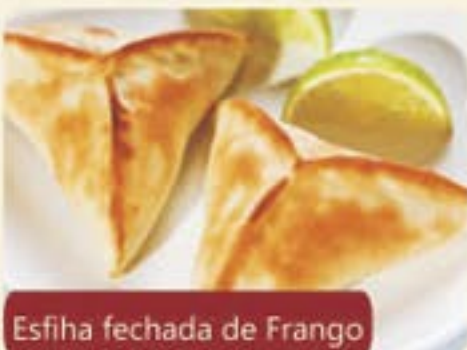
Esfiha fechada de Frango