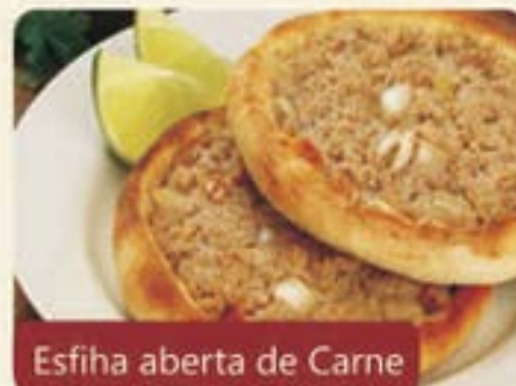
Esfiha aberta de Carne